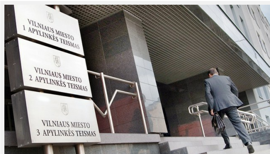
Fundacja Praw Człowieka reprezentuje w sądach rodziny ubiegające się o oryginalny zapis imienia i nazwiska w dokumentach tożsamości

Europejska Fundacja Praw Człowieka od lat walczy o prawo do oryginalnego zapisu imienia i nazwiska w litewskich dokumentach. Niestety, sądy często okazują się bezielne.